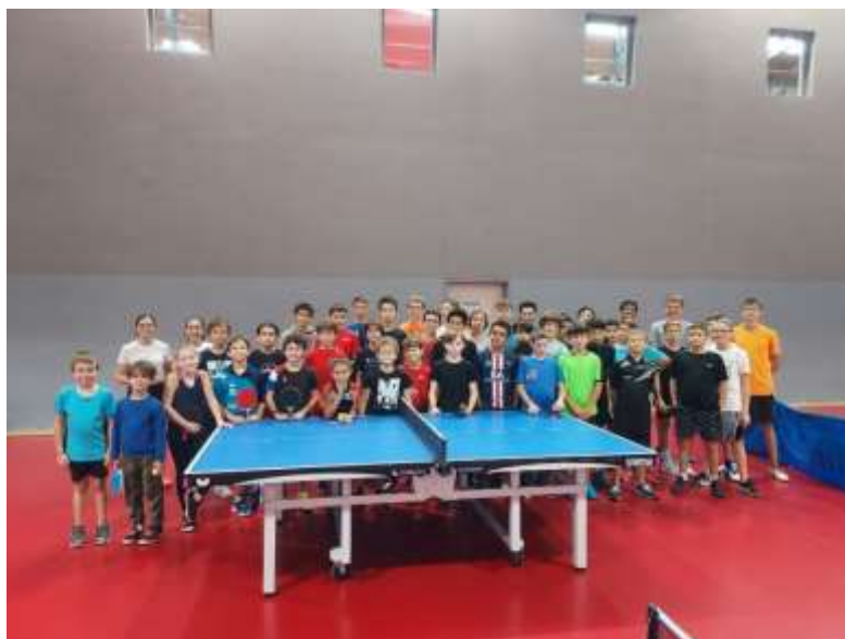
STAGE ARTENIUM OCTOBRE 2022

Veillez recevoir Madame, Monsieur mes salutations sportives.